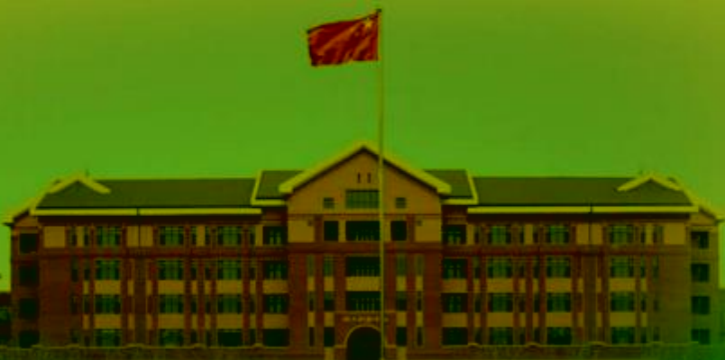
天津机电职业技术学院

TIANJIN VOCATIONAL COLLEGE OF MECHANICAL AND ELECTRICAL ENGINEERING